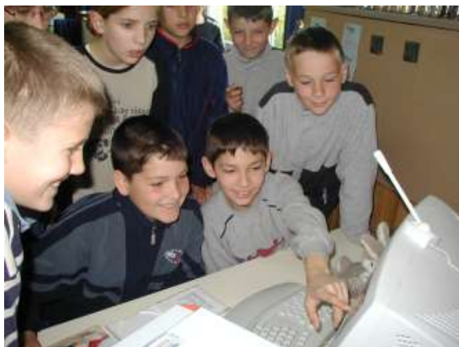
Slika 6. Radost i zadovoljstvo na licima bivših učenika škole u Klakaru prilikom pregledavanja časopisa Klik-klak u čijem su stvaranju i sami ranije sudjelovali

U Hrvatskoj se to vrlo često odnosi na sudjelovanje u različitim folklornim aktivnostima u kojima djeca u nošnjama pjevaju, sviraju i plešu nastojeći dočarati život u prošlosti bez njegovog dubljeg razumijevanja. Time postaju dekoracija na svečanostima koje organiziraju odrasli. Umjesto toga, u našem projektu učenici su aktivno sudjelovali u stvaranju kulturnog proizvoda koji je postao prepoznatljiv i izvan njihovog mjesta što dokazuje sljedeći komentar čitatelja: „Moja prijateljica iz Japana je našla vaš blog, i voli ga, jer je uči o jeziku i kulturi Hrvatske! Vaš blog je veoma interesantan i mi jedva čekamo da pročitamo još vaših radova!“ (Mariko i Kamegoro, osobna komunikacija, 18. svibnja 2006)