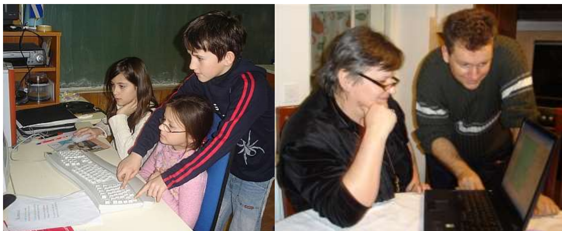
Slika 4. Međusobna pomoć u korištenju računala

Nakon nekog vremena i učenici prvog razreda su počeli objavljivati svoje članke. Nekoliko starijih učenika je izrazilo nezadovoljstvo njihovim sporim pisanjem i težim snalaženjem na računalo, ali su im ipak pomagali u objavljivanju tekstova ( http://youtu.be/tNez3nTwG7M ). Učili smo koristiti računalo i različite računalne programe tako da smo jedni drugima pomagali (slika 4).