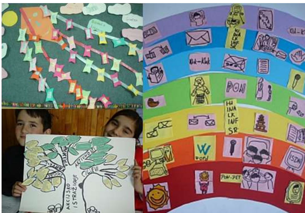
Slika 1. Učeničke likovne izvedbe planova akcijskog istraživanja

Uvažavajući učeničke ideje dogovorili smo se da pokušamo ostvariti četiri osnovna cilja: unapređivanje dječjeg pismenog stvaralaštva, osposobljavanje učenika i učiteljice za korištenje računala, njegovanje i očuvanje zavičajne kulture, a posebno blog sustava te zadovoljstvo učenika sudjelovanjem u tim aktivnostima (tablica 1). To smo namjeravali ostvariti korištenjem metoda kreativnog pisanja, istraživanjem narodnih običaja, nošnji, igara, igračaka, pučkih pjesama, alata, zanimanja, života u prošlosti, kroz razgovore s mještanima, čitanjem i prikupljanjem starih knjiga, prikupljanjem starih predmeta, pisanjem tekstova u Wordu, fotografiranjem i grafičkom obradom fotografija na računalu, korištenjem Internet preglednika, korištenjem programa za slanje e-pošte i drugim nastavnim i izvannastavnim aktivnostima učenika.